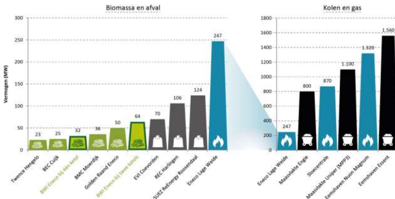
Figuur 2: BWI ten opzichte van andere centrales 13

Door de BWI te vergelijken met andere nieuwe centrales in Nederland, kan een gevoel worden gekregen hoe groot de centrale wordt en welke (potentiële) invloed dat heeft op de emissies en luchtkwaliteit. We kijken hierbij naar kolen-, gas-, afval- en biomassacentrales, zie figuur 2.